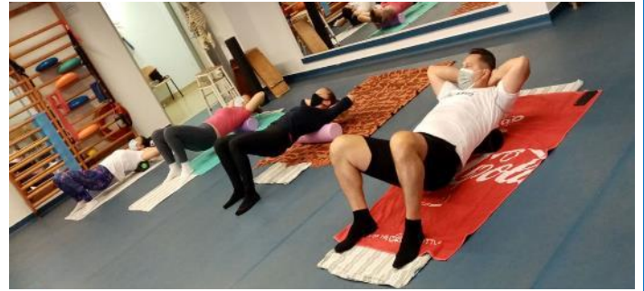
Dolgozói torna a Kátai Gábor Kórházban