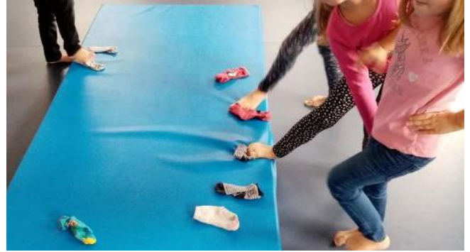
Lúdtalp megelőzésére és kezelésére irányuló tornafoglalkozás óvodáskorúak részére Kisújszálláson